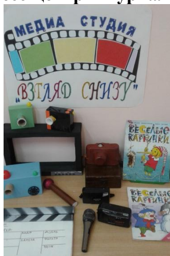
Сюжетно-ролевые игры: «Журналист», «Звукооператор», «Берем интервью»